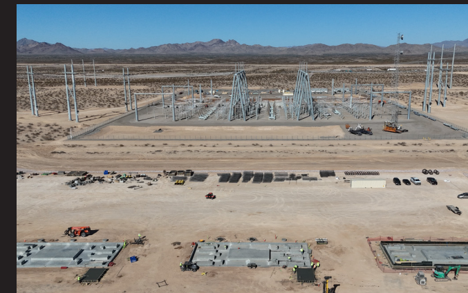
El proyecto solar Atlas suministrará 100 MW de energía renovable a los clientes de 3CE

El almacenamiento en baterías es esencial para la transición de California hacia energía libre de carbono. El proyecto de almacenamiento de energía Willow Rock no es un banco de baterías típico; en vez de litio usa aire comprimido para generar energía. Al respaldar proyectos como este, los clientes de 3CE están contribuyendo a una innovación revolucionaria.